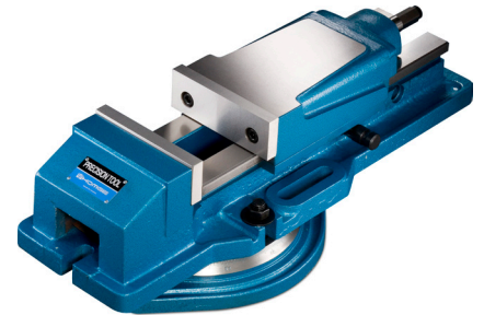
Drehteller und Spannschlüssel